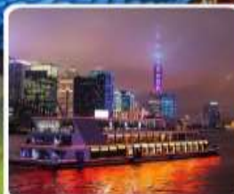
ส่องเรือแม่น้ำหวงผู่