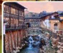
เมืองโบราณเหย้าหู