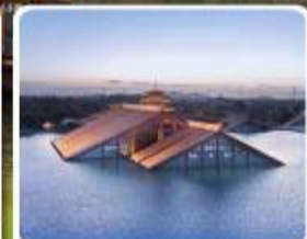
พิพิธภัณฑ์ไดน้ำ กงฟู่หลิน