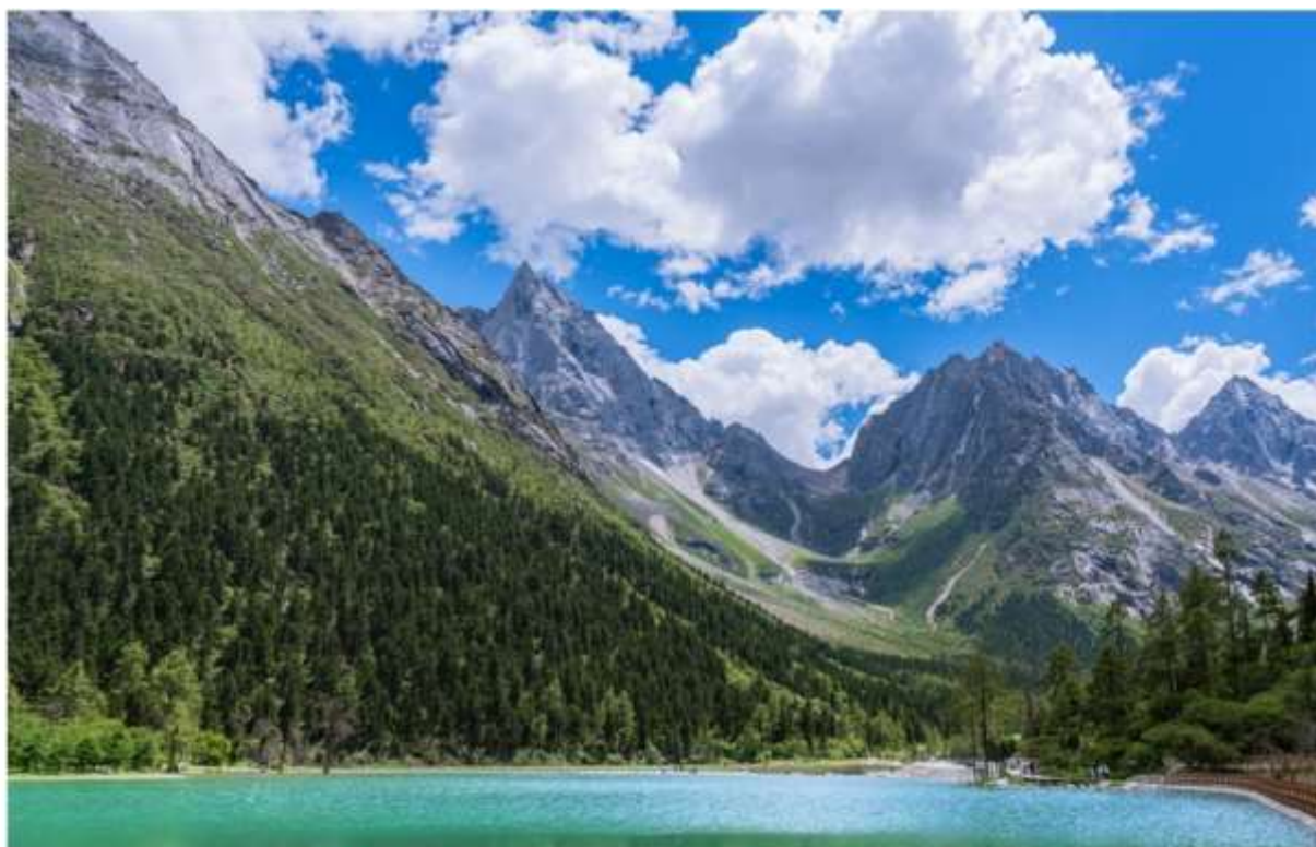
BIPENGGOU NATIONAL PARK 毕棚沟