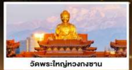
วัดพระใหญ่หวงกงซาน