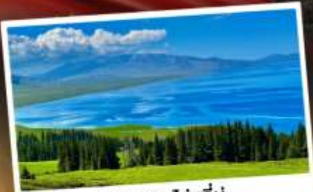
ทะเลสาบไซทาลีนู