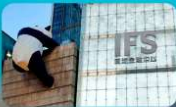
ถนนคนเดินซุนซีลู่