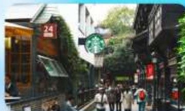
ถนนชอยกวางซวยแคบ