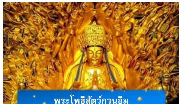
พระโพธิสัตว์กวนอิม

นำท่านเดินทางสู่ มรดกโลกอุทยานผาหินแกะสลักต้าจู่ ศิลปะหินแกะสลักอันล้ำค่าแห่งเมืองฉงชิ่งมรดกโลกที่องค์การยูเนสโกขึ้นทะเบียนเมื่อปี ค.ศ. 1999 ตั้งอยู่ทางตะวันตกของนครฉงชิ่ง ประเทศจีน ศิลปะหินแกะสลักเหล่านี้สร้างขึ้นตั้งแต่ราชวงศ์ถังจนถึงราชวงศ์ซ่ง มีอายุมากกว่า 1,000 ปี โดดเด่นด้วยงานแกะสลักทางพุทธศาสนาที่งดงามและยังคงสภาพสมบูรณ์ (ใช้เวลาเดินทางประมาณ 1-2 ชั่วโมง)