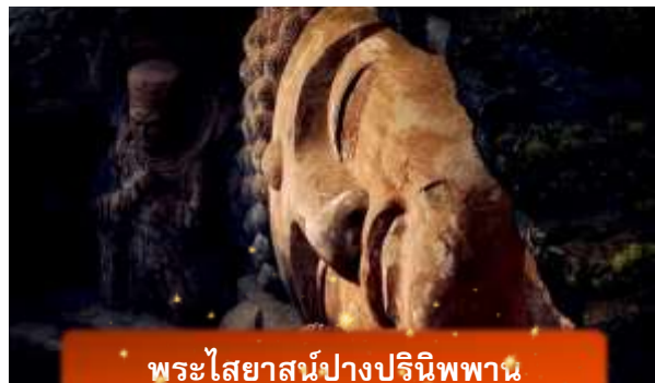
พระไสยาสน์ปางปรินิพพาน