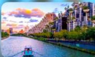
อาคารพินตันไม้

ARTELS COLLECTION / HOLIDAY INN EXPRESS HOTEL หรือเทียบเท่า 4 คาว