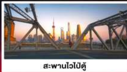
สะพานไวปู้ตู่