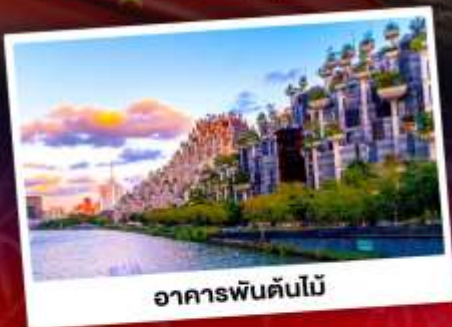
อาคารพินตันไม้