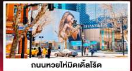
ถนนหยยไหม่ดเคิ้ลโรด