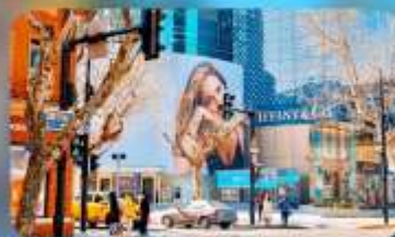
ถนนทวยไห้มิดเคิ้ลโรัด