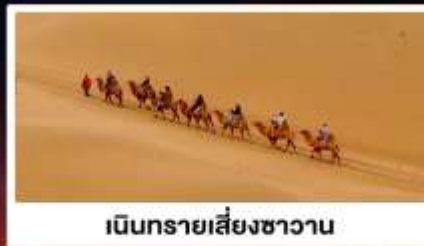
เนินทรายเสี่ยงชวอน