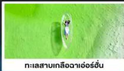
ทะเลสาบเกลือดาเอ๋อร์อัน