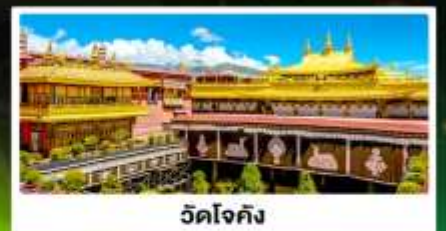
วัดโจกิง

🧳 พกกระเป๋า 1 ชิ้น น้ำหนัก: 4 กิโลกรัม (รวม 2/ข้าง)