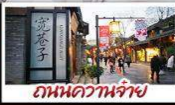
ถนนความจำ