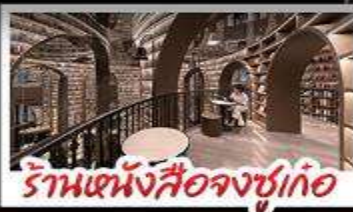
ร้านหนังสือจุงชุกเกอ

อุทยานภูทาสี่ฤดู อุทยานปิ่นผิงทาว หนีแพนตันออนแซลฟี ร้านหนังสือจุงชุกเกอ วัดต้าฉือ ถนนโบราณความจำ ช้อปปิ้งยามดึก ถนนไท่กู่หลี่ + ถนนซุนซีตู้ เมนูพิเศษ สุกี้หม่าล่าเสฉวน