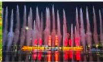
น้ำพุคังปาซือ