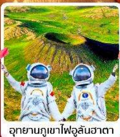
อุทยานภูเขาไฟอูลันฮาตา