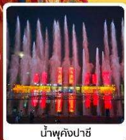
น้ำพุคังปาซี

● โอโหล้ เป็นทราเวลสายการบิน 5A ของจีน ภูเขาไฟอูลันฮาตา น้ำพุคังปาซี น้ำพุที่สูงที่สุดในเอเชีย