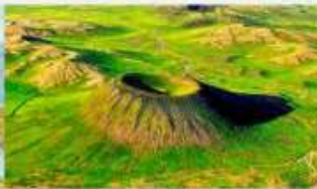
อุทยานภูเขาไฟอูลันฮาตา