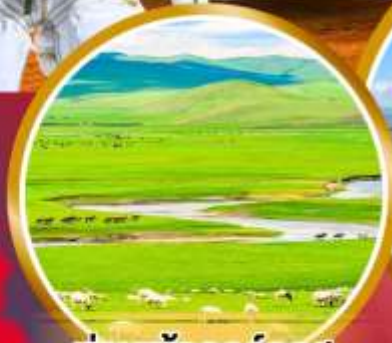
กุ้งหล้าออร์โดส