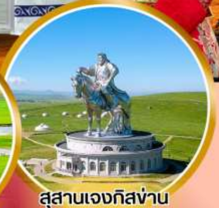
สุสานเจงกิสข่าน