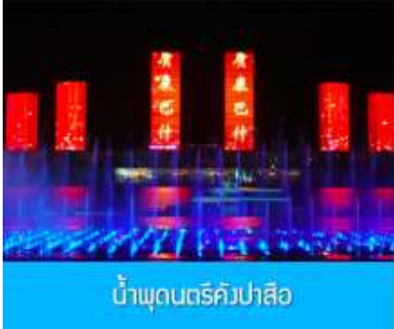
น้ำพุดนตรีคังปาสือ

จากนั้นนำท่านเดินทางกลับสู่ เมืองเออร์ดอส 鄂尔多斯 (ระยะทาง 180 กิโลเมตรใช้เวลาประมาณ 3 ชั่วโมง ) รับประทานอาหารค่ำ ณ ภัตตาคาร (9)