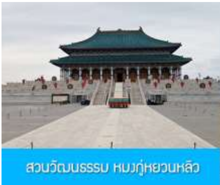
สวนวัฒนธรรมหมงกู่หยวนหลิว

พักที่ ORDOS BOYU AIRUI HOTEL โรงแรมระดับ 4 ดาวท้องถิ่น หรือเทียบเท่าในเมืองเออร์ดอส