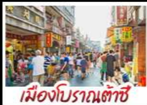
เมืองโบราณต้าชี่

ล่องแพไม้ไผ่ชมแม่น้ำหลี่เจียง - กางวงช้าง กำลือ้อ - เมืองโบราณต้าชี่ เจดีย์เงินเจดีย์ทอง ซ้อปั้งถนนคนเดิน - ถนนชี่เจียง - ถนนชี่เจียง เมบูพิศช บุปฟ้าซาบูซึฟูด ปลายอบเบียร์ สุกี้เท็ด