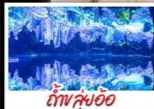
ถ้ำหลือ้อ