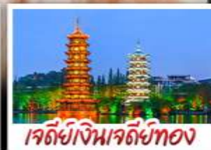
เจดีย์เงินเจดีย์ทอง