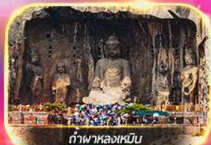
ถ้ำพาลงเหมิน