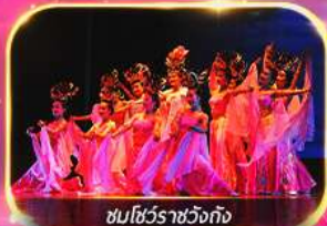
ชมโชว์ราชวงศ์ถัง

นั่งรถไฟความเร็วสูง ย้อนชมประวัติศาสตร์อันยิ่งใหญ่ "กองทัพทหารจีนซี" * พิเศษ!! ชมซากุระ & เทศกาลดอกโบตั๋น 1 ปี มีเพียงครั้งเดียว !! *