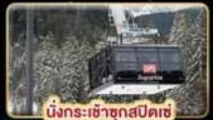
นั่งกระเช้าซุกสปีดเซ