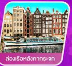
ส่องเรือหลังคากระจก

✈ เดินทาง 01- 08 เม.ย. 69 | 30 เม.ย.- 07 พ.ค.69