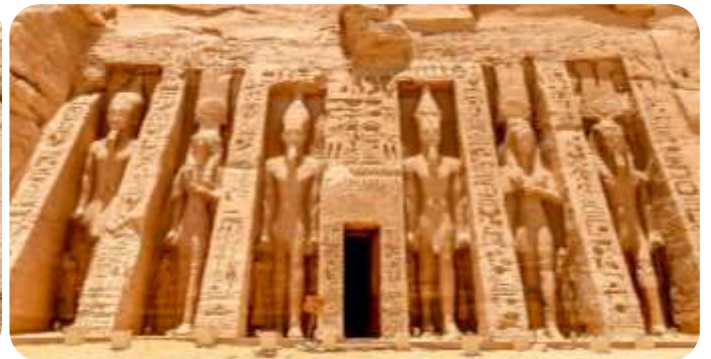
สมควรแก่เวลานำท่านเดินทางกลับเมืองอัสวาน