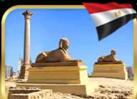
เสาริมันปอมเปย์