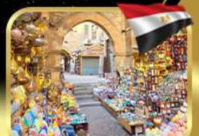
ตลาดชานอลคาลิ