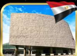
ห้องสมุดอเล็กซานเดรีย