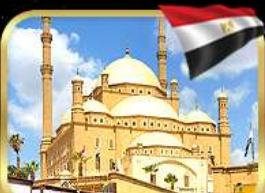
มัสยิดโมฮัมหมัดอาลี