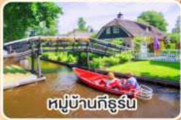
หมู่บ้านทีร์ูร์น