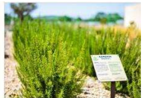
The Mediterranean Garden