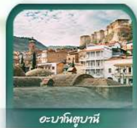
อะบาโนตูปานี