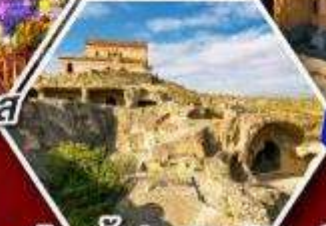
เมืองถ้ำอพลิสต์ซีเคห์