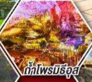
ถ้ำไฟรมิธิอุส