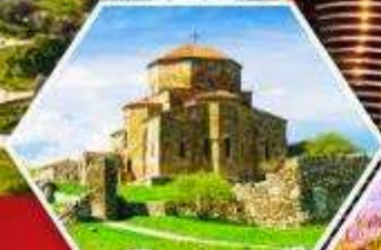
วิหารจวารี