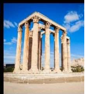
Temple Of Olympian