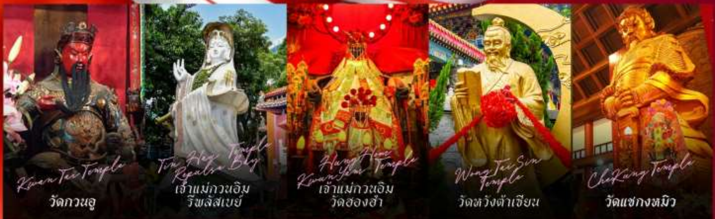
Kwan Tai Temple วัดกวนอู

รายการทัวร์ข้างต้นอาจมีการปรับเปลี่ยนเพื่อความเหมาะสม