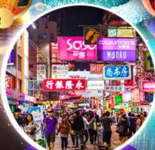
Shopping Taim Sha Tsui