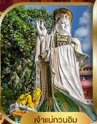
เจ้าแม่กวนอิม ริฟลิสซีย์