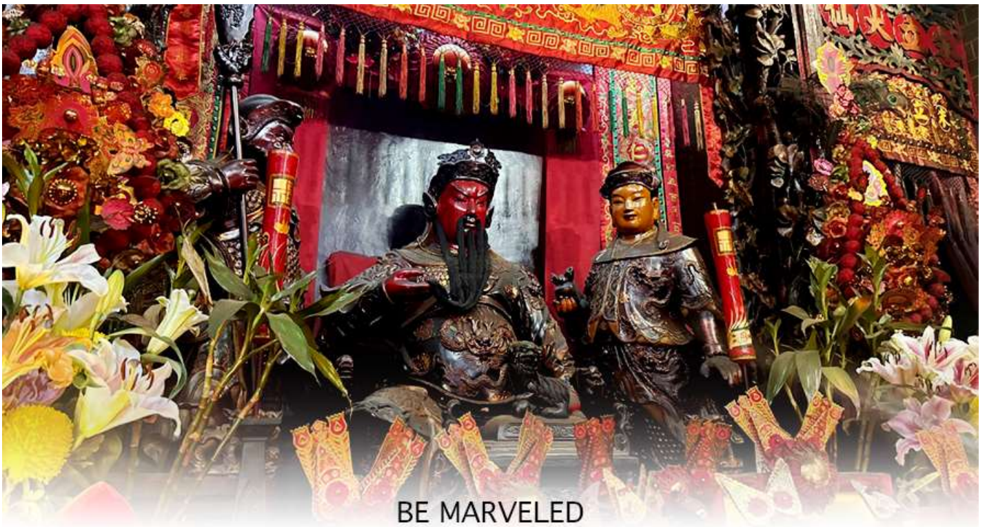
BE MARVELED วัดกวนอู

เจ้าแม่ทับทิม หรือ เทพธิดาแห่งท้องทะเล ซึ่งทำหน้าที่ปกป้องคุ้มครองชาวประมง ตั้งโดดเด่นอยู่ท่ามกลางสวนสวยที่ทอดยาวลงสู่ชายหาดให้ท่านนมัสการขอ และนำท่านเดินข้าม สะพานต่ออายุ ซึ่งเชื่อกันว่าข้ามหนึ่งครั้งจะมีอายุเพิ่มขึ้น 3 ถ้าข้ามแล้วห้ามเดินย้อนกลับไปเด็ดขาด เพราะคนฮ่องกงเชื่อว่าชีวิตจะสั้นลงไป 3 ปี สำหรับคนโสดจะนิยมขอพรกับ เทพเจ้าแห่งความรัก ให้เอามือลูบที่บริเวณหินสีดำ พร้อมกับอธิษฐานให้สมหวังกับความรัก ปิดท้ายด้วยการรับพลังฮวงจุ้ยจาก ศาลา แปะทิส ซึ่งถือเป็นจุดรวมรับพลัง ถือเป็นจุดที่มีฮวงจุ้ยดีที่สุดในเกาะฮ่องกง และยังมีรูปปั้นองค์เทพอีกมากมายภายในวัดแห่งนี้ให้กราบไหว้ขอพร