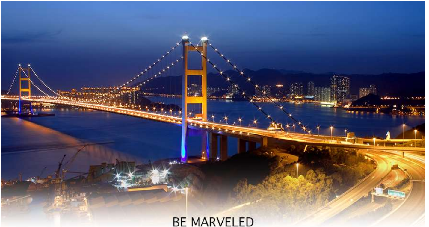
BE MARVELED สะพานแขวนฉิวหม่า