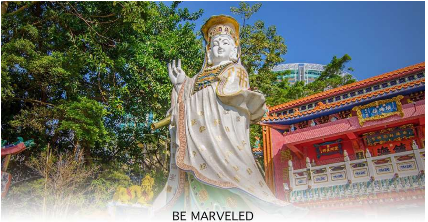
BE MARVELED วัดเจ้าแม่กวนอิมริพลัสเบีย