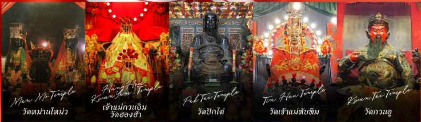
Man Mo Temple วัดหม่านโหม่ว

รายการทัวร์ข้างต้นอาจมีการปรับเปลี่ยนเพื่อความเหมาะสม