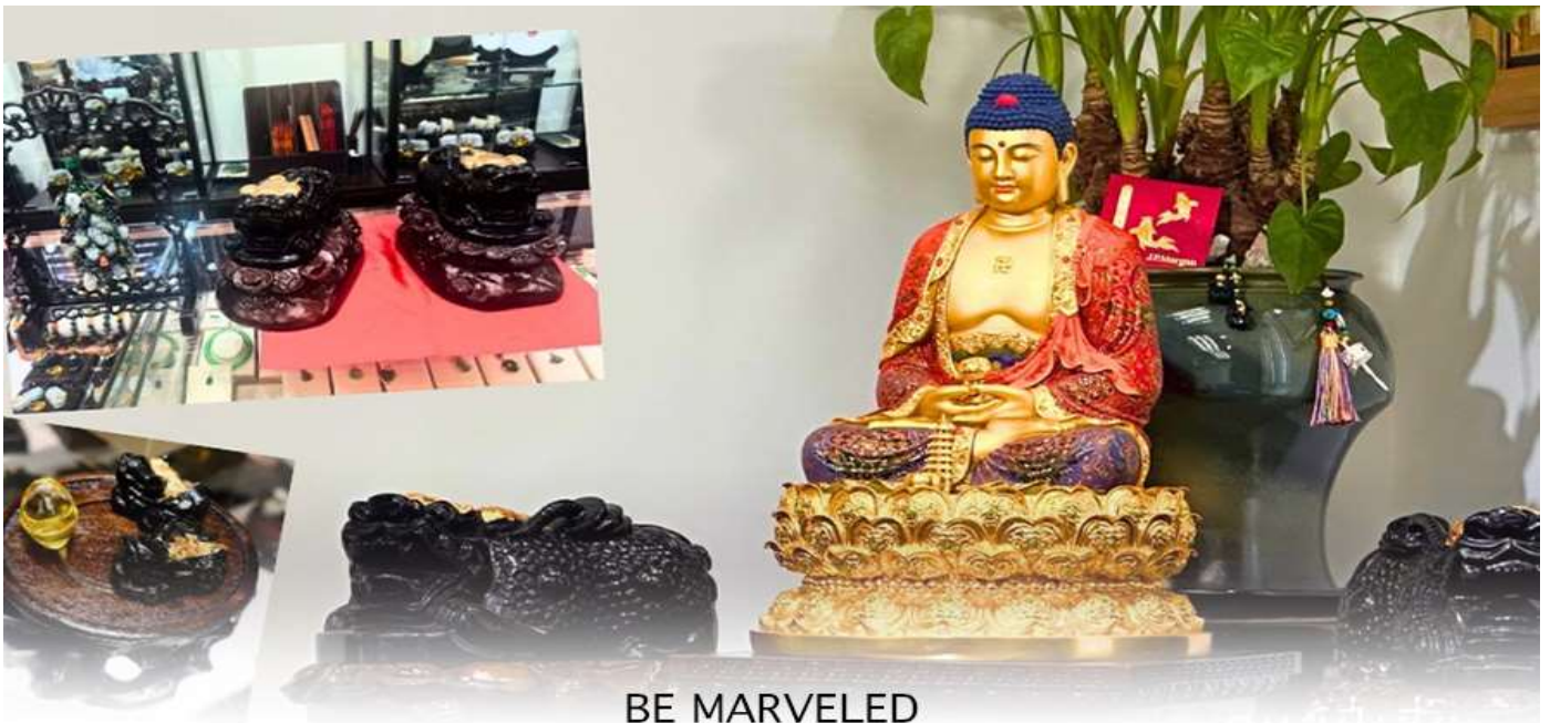
BE MARVELED ศูนย์ปี่เซี่ยะ