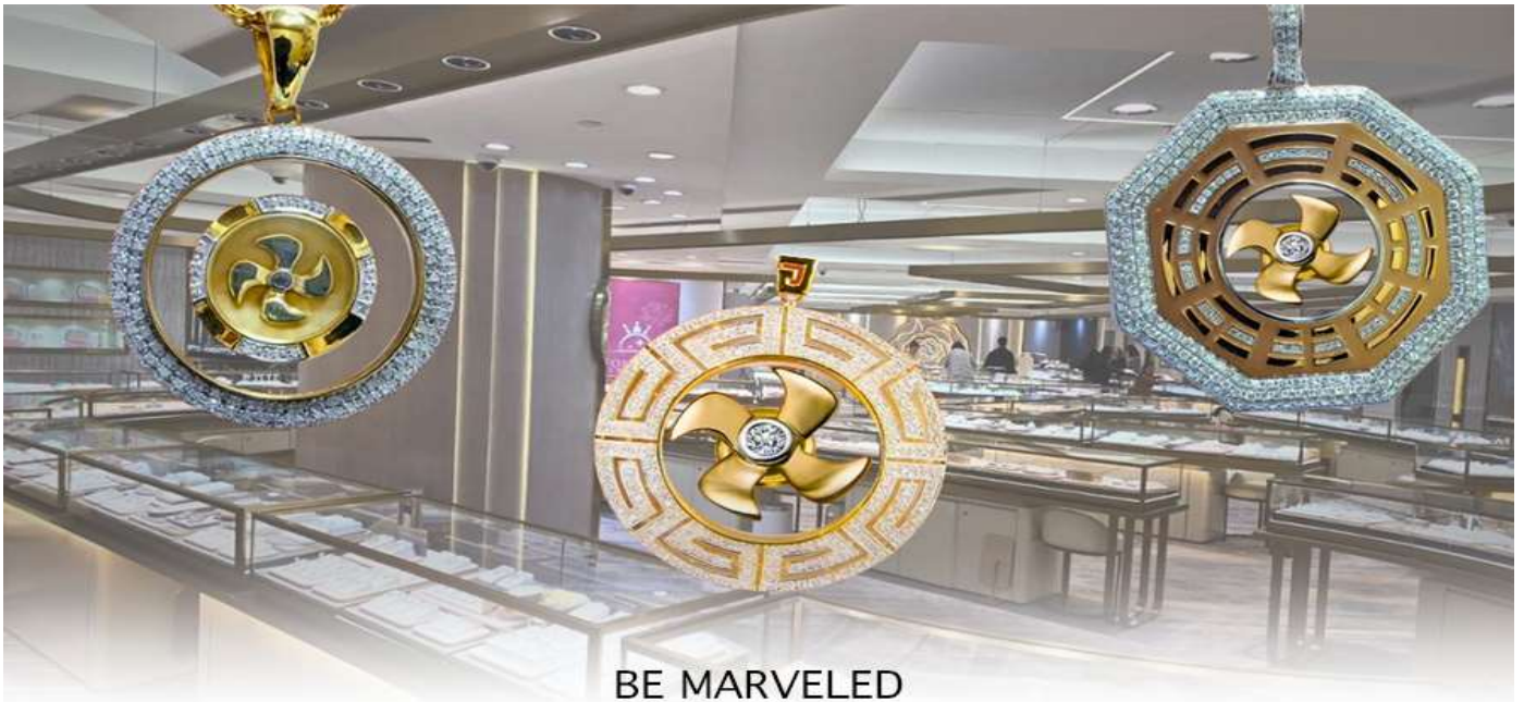
BE MARVELED ศูนย์ฮวงจุ้ย กั๊กหันเศรษฐี

ความเชื่อว่าหยก มงคล ถ้าพกติดตัวไว้จะอายุยืนและสุขภาพดีมีสินค้ามากมายเกี่ยวกับหยก อาทิ กำไลหยก หรือสัตว์นำโชค อย่างปี่เซี่ยะ ให้ท่านได้เลือกซื้อเป็นของฝาก, ของที่ระลึก หรือของนำโชคแต่ตัวท่านเอง