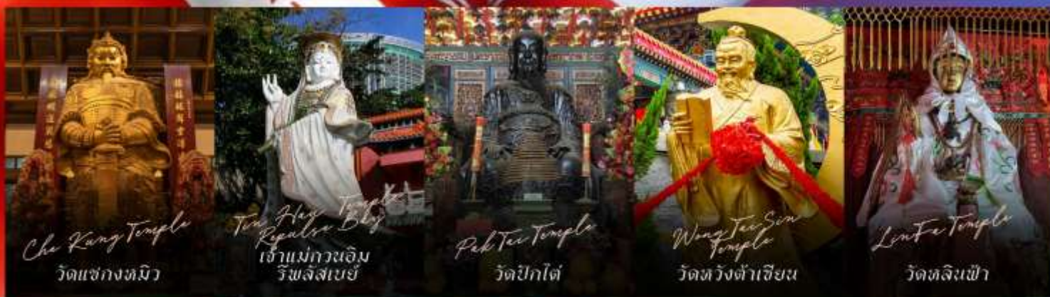
Che Kung Temple วัดเซกทงหมิว

รายการทัวร์ข้างต้นอาจมีการปรับเปลี่ยนเพื่อความเหมาะสม