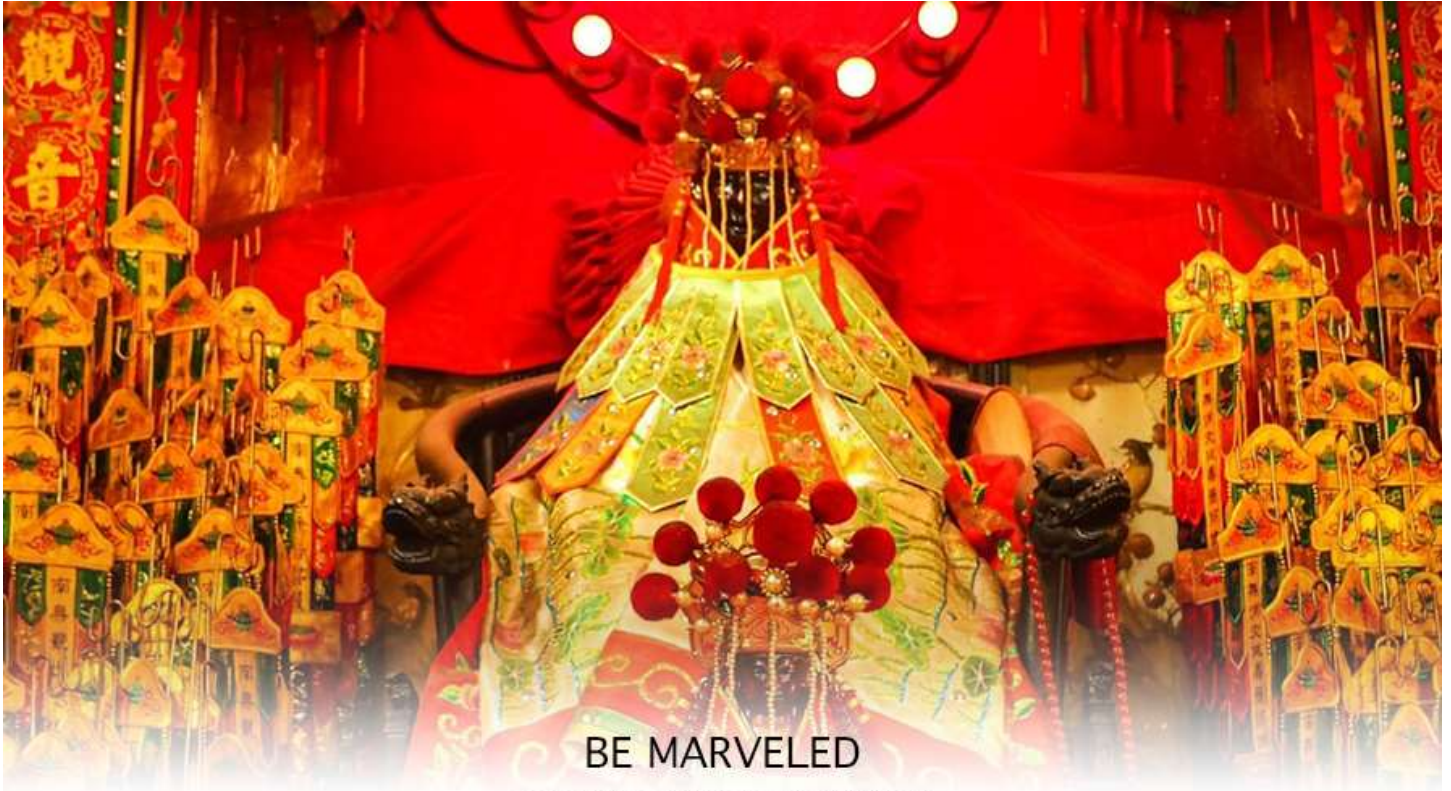
BE MARVELED วัดเจ้าแม่กวนอิมฮวงอ่า (ยิมวิน)

เชื่อของคนจีนใน ฮ่องกง-มาเก๊า จะมี "วันเปิดทรัพย์" หรือ "พิธียืมเงิน เจ้าแม่กวนอิมฮ่องกง" เป็นวันที่จะมาขอพรและยืมเงินเจ้าแม่กวนอิมซึ่งนับจากหลังวันตรุษจีน ไป 26 วัน จะเป็นวันเปิดทรัพย์ที่จัดขึ้นในทุกๆปี พิธีนี้จะมีเพียงครั้งปีละครั้งเท่านั้น เป็นวันสำคัญอีกวันที่คนหลังไหลมาไหว้ขอพรอย่างไม่ขาดสาย