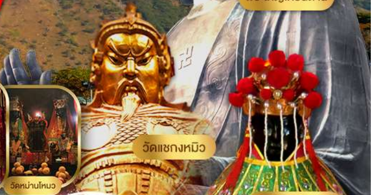
วัดแซกทงมิง