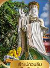
เจ้าแม่กวนอิม รพัสสเบย์