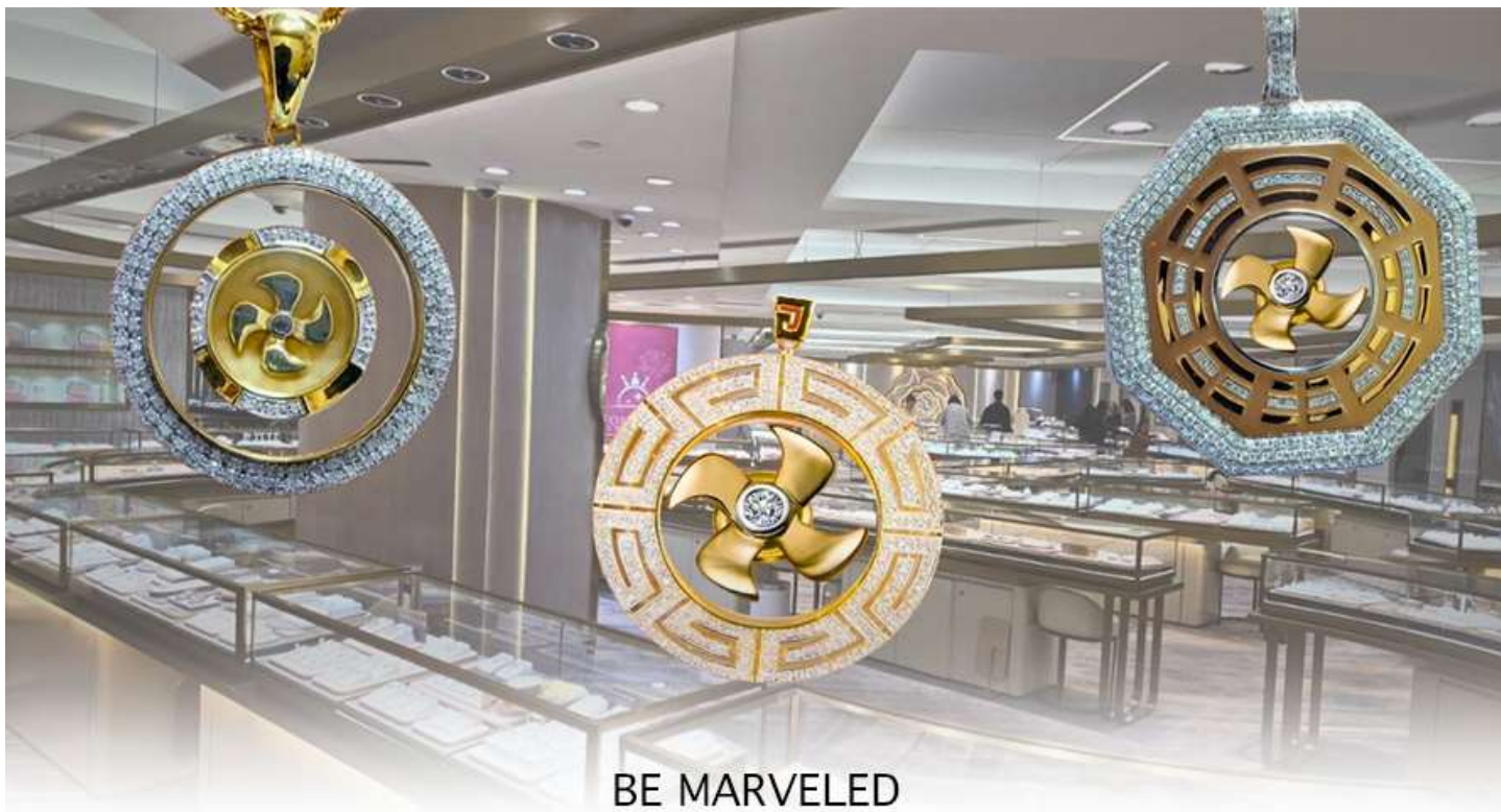
BE MARVELED ศูนย์อวรุญ กัณฑ์เศรษฐี

และนำท่านชม ศูนย์ปี่เซี่ยะ ซึ่งคนจีนนั้น ถือว่าหยกเป็นหิน ที่เป็นตัวแทนของความสวยงามและความบริสุทธิ์มีความเชื่อว่าหยก มงคล ถ้าพกติดตัวไว้จะอายุยืนและสุขภาพดีมีสินค้ามากมายเกี่ยวกับหยก อาทิ กำไลหยก หรือสัตว์นำโชคอย่างปี่เซี่ยะ ให้ท่าน ได้เลือกซื้อเป็นของฝาก, ของที่ระลึก หรือของนำโชคแต่ตัวท่านเอง