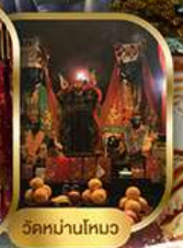
วัดหนานโหมง