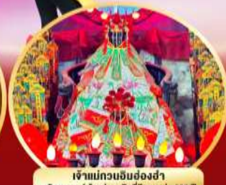
เจ้าแม่กวนอิมย้งฮงฮ่า นมัสการองค์เจ้าแม่กวนอิมที่มีอายุกว่า 600 ปี