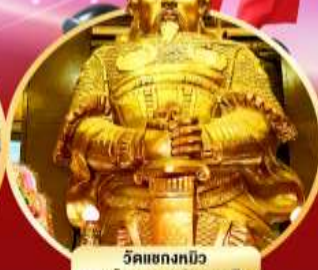
วัดเขกงกมือ ขอพรโชคลาภ การเงิน และสุขภาพ