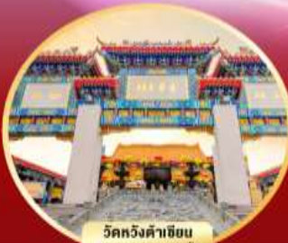
วัดหวังต้าเซียน ขอพรสุขภาพ ความรัก