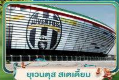
ยูเวนตุส สเตเดียม

เที่ยวฟรีโตไฟฟ์! หมู่บ้านตากอากาศสุดไฮโซ ณ ชายฝั่งริเวียร่า