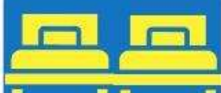
ห้องพักเตียงคู่ TWIN