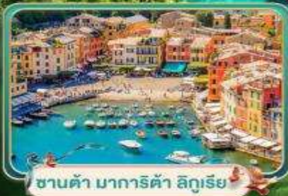
ซานต้า มาการิต้า ลิกูเรีย