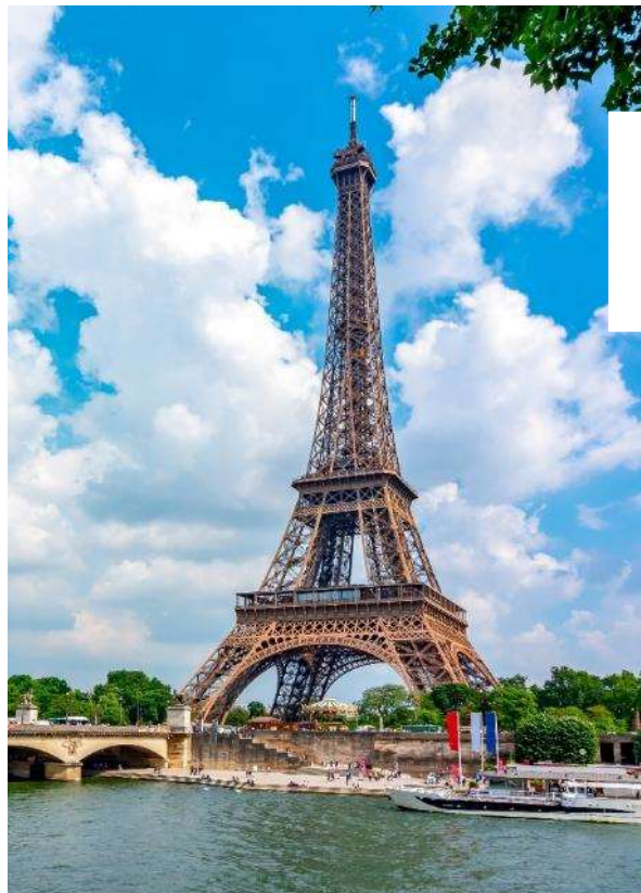
ล่องเรือชมแม่น้ำแซนน์ Seine River Cruise