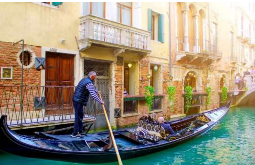
นำท่านเดินทางกลับสู่ “เมืองเวนิส-เมสเตรี” บริการอาหารค่ำ ณ ภัตตาคาร

ตัวมหาวิหารจะเชื่อมกับ พระราชวังดอร์จ (Doge's Palace) พระราชวังแบบเวนิส-โกธิคที่ครั้งหนึ่งเคยเป็นที่ประทับของยุคแห่งเวนิสครั้งที่เมืองนี้ยังเป็น สาธารณะรัฐเวนิส ก่อนได้รับการปรับปรุงเป็นพิพิธภัณฑ์และเปิดอย่างเป็นทางการในปี 1923 สะพานถอนหายใจ (Bridge of Sighs) สะพานซุ้มโค้งที่เชื่อมระหว่างพระราชวังดอร์จและเรือนจำ จากนั้นเชิญท่านสัมผัสกับเสน่ห์ของคลองเวนิสอันแสนโรแมนติก ผ่านประสบการณ์สุดพิเศษกับการ “นั่งเรือกอนโดล่า” (Gondola) พาหนะคู่เมืองที่มีชื่อเสียงระดับโลก พร้อมเพลิดเพลินกับบรรยากาศและทิวทัศน์