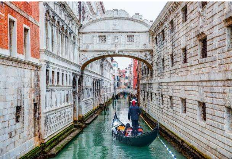
อังกดงามของเวนิส

ตัวมหาวิหารจะเชื่อมกับ พระราชวังดอร์จ (Doge's Palace) พระราชวังแบบเวนิส-โกธิคที่ครั้งหนึ่งเคยเป็นที่ประทับของยุคแห่งเวนิสครั้งที่เมืองนี้ยังเป็น สาธารณะรัฐเวนิส ก่อนได้รับการปรับปรุงเป็นพิพิธภัณฑ์และเปิดอย่างเป็นทางการในปี 1923 สะพานถอนหายใจ (Bridge of Sighs) สะพานซุ้มโค้งที่เชื่อมระหว่างพระราชวังดอร์จและเรือนจำ จากนั้นเชิญท่านสัมผัสกับเสน่ห์ของคลองเวนิสอันแสนโรแมนติก ผ่านประสบการณ์สุดพิเศษกับการ “นั่งเรือกอนโดล่า” (Gondola) พาหนะคู่เมืองที่มีชื่อเสียงระดับโลก พร้อมเพลิดเพลินกับบรรยากาศและทิวทัศน์