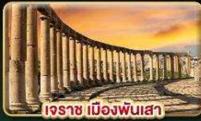
เอรราช เมืองพันเสา