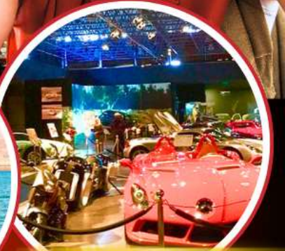
Royal Automobile Museum