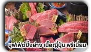
บุฟเฟ่ต์บั้งย่าง เนื้อญี่ปุ่น พรีเมียม