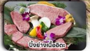
บั้งย่างเนื้ออึดะ