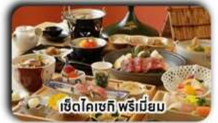
เซตโคเชกิ พรีเมียม