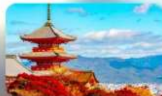
วัดคิโยมิชิ