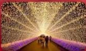
นาบานาโนะซาโตะ