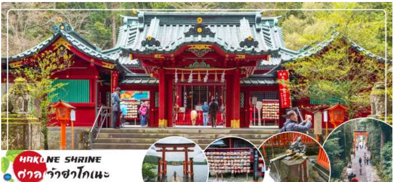
HAKONE SHRINE ศาลเจ้าฮาโกเนะ

จากนั้นนำท่าน ชมวิวทะเลสาบ 5 ศาลเจ้าฮาโกเนะ (Hakone Shrines) (ใช้เวลาเดินทางประมาณ 30 นาที) ศาลเจ้าเก่าแก่ในศาสนาชินโต ตั้งอยู่บริเวณตีนเขาฮาโกเนะ และอยู่ริมทะเลสาบอะชิ จังหวัดคานากาวา ประเทศญี่ปุ่น ไฮไลท์!!! เส้าโทริอิสี่แดง ริมทะเลสาบที่เป็นจุดถ่ายรูปยอดนิยม อีสระให้ท่านขอพรและถ่ายรูปตามอัธยาศัย