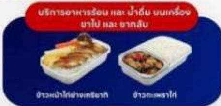
บริการอาหารร้อน และ น้ำดื่ม บนเครื่อง ขาไป และ ขากลับ