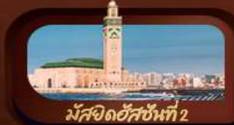
มัสยิดฮัสซันที่ 2