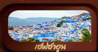
เชฟชาอูน