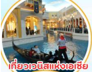
เที่ยวเวนิสแห่งเอเชีย