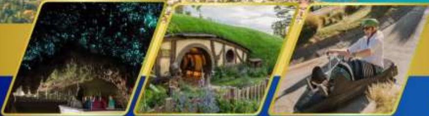
ถ้ำหอนเรื่องแสง หมู่บ้านฮ็อบบิต เล่นลู่ที่ควีนส์ทาวน์

10-19 ตุลาคม 2569 17-26 ตุลาคม 2569 14-23 พฤศจิกายน 5-14 ธันวาคม 2569 (วันพ่อแห่งชาติ)