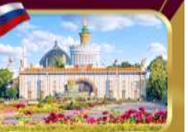
สวนสาธารณะ VDNKH