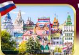
อิสมายลอฟสกีมาร์เก็ต