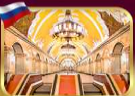
สถานีรถไฟใต้ดินกรุงมอสโก