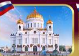
มหาวิหารเซนต์ซาเวียร์