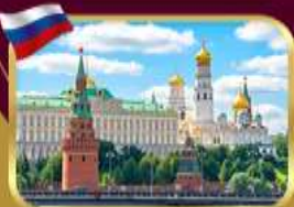
พระราชวังเครมลิน