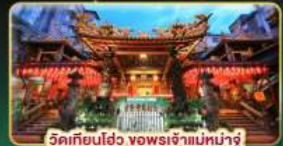
วัดเทียนโถ้ว ขงพรเจ้าแม่หม่าจู๋