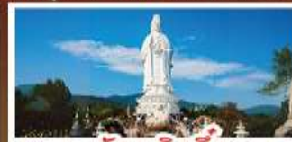
วัดหลินอิ่ง