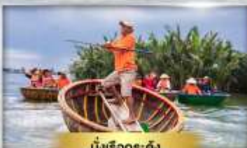
มังเรือกระดัง