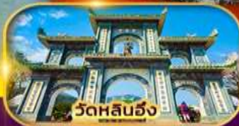
วัดหลันฮั่ง