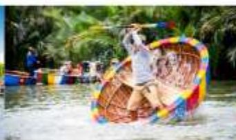
ล่องเรือกระดิ่ง