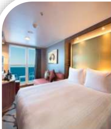
Oceanview Stateroom with Balcony