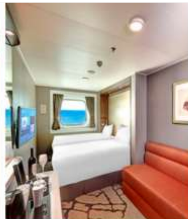
Oceanview Stateroom with Window