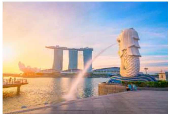
นำท่าน ชมเมือง สิงคโปร์ นำท่าน ถ่ายรูปคู่กับ เมอร์ไลออน

ไลออน สัญลักษณ์ของประเทศสิงคโปร์ โดยรูปปั้นครึ่งสิงโตครึ่งปลาที่หันหน้าออกทางอ่าวมารินา มีทัศนียภาพที่สวยงาม โดยมีฉากด้านหลังเป็น “โรงละครเอสเพลนาท” ซึ่งโดดเด่นด้วยสถาปัตยกรรมคล้ายหนามทุเรียน ชมถนนอลิซาเบธวอล์ค ซึ่งเป็นจุดชมวิวยามเย็นน้ำสิงคโปร์