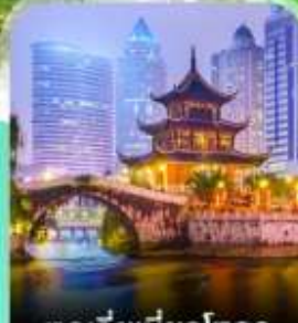
หอเจียเซียวโหลว