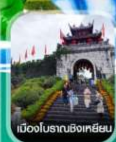
เมืองโบราณชิงเหยียน

คอนเฟิร์มออกเดินทาง ทุกพีเรียด 2 ท่านขึ้นไป