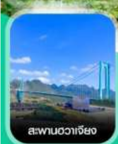
สะพานฮวาเจียง